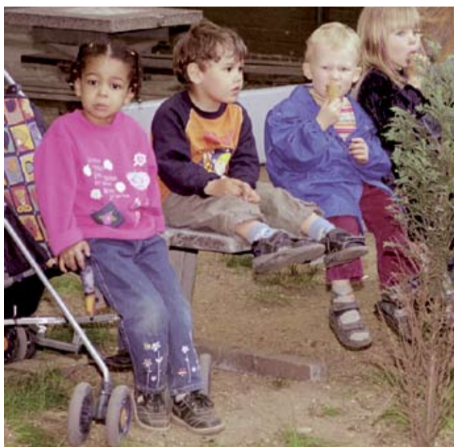
Feste Partnerschaften zwischen Unternehmen und sozialen Einrichtungen

Voraussetzung dafür ist, dass die Unternehmen ebenfalls von einer solchen Partnerschaft profitieren und aus den vielfältigen Ressourcen wie pädagogisches, künstlerisches Know-how, soziale Kompetenzen, Räumlichkeiten usw. der Einrichtungen etwas zurück erhalten. Erst so kann eine gleichberechtigte Partnerschaft entstehen!