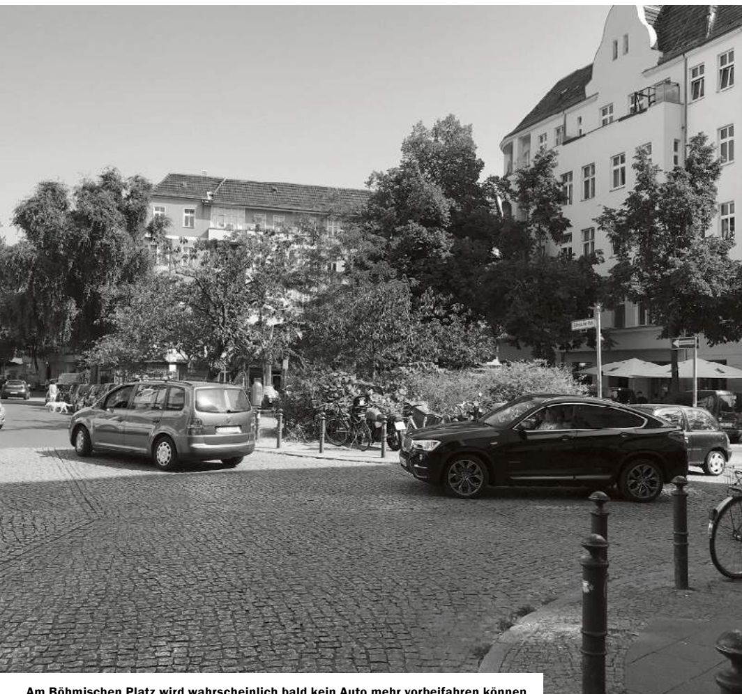
Am Böhmischem Platz wird wahrscheinlich bald kein Auto mehr vorbeifahren können

Text: Kerstin Heinze