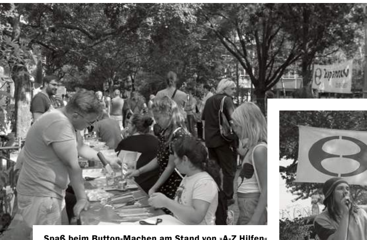
Spaß beim Button-Machen am Stand von »A-Z Hilfen«

Danke, liebe Besucher*innen und Mitarbeitende des Sommerfestes am Esperantoplatz, welches bei herrlichem